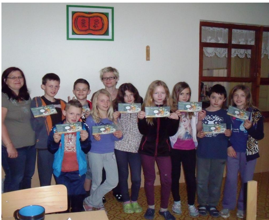
Tak to jsme my „Anderseni“.

Dneska byla stezka, byla vážně hezká Plníme úkoly, ale nejsou do školy. Pak jsme si četli knihu, a na ní měli pihu Večer jsme měli táborák, který nebyl na horách Byla černá noc, už nám nemusíte chodit na pomoc Paní učitelky neměly ranní a tak nás poslali na spaní